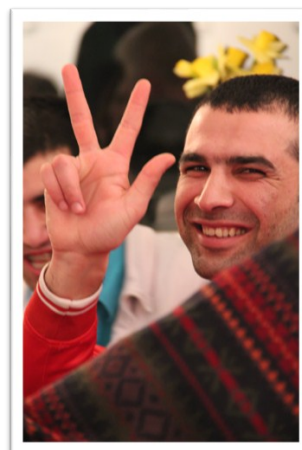
Tre nye var på valg